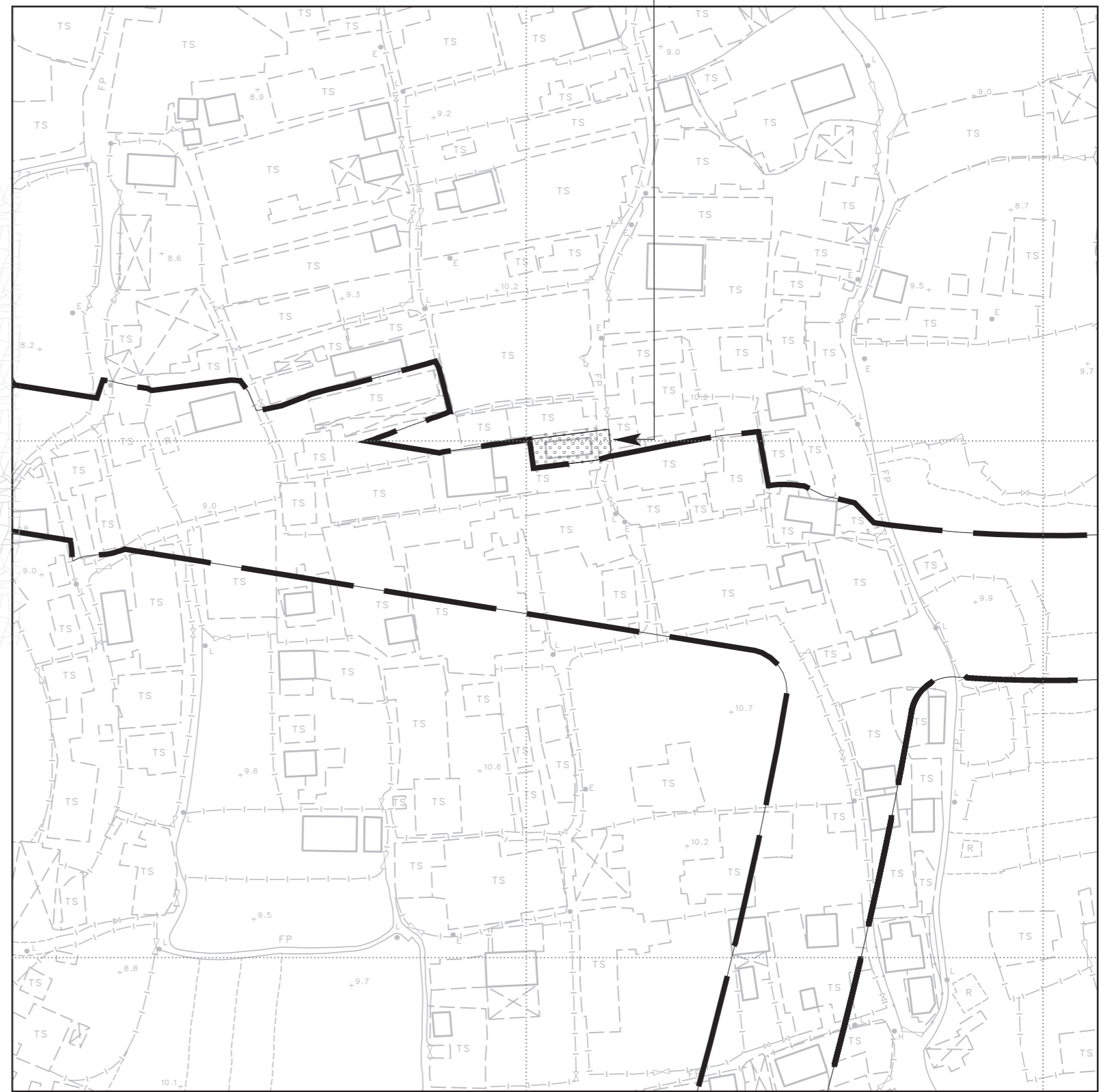
圖 A MAP A

在圖則編號YLM10745(第五張)上顯示的收地/清拆範圍須予縮減。 The extent of land resumption / clearance shown on Plan No. YLM10745 (Sheet 5) shall be reduced.